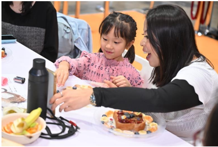
圖：有家長與小朋友一同參與工作坊，享受親子時光。

展會精彩活動亦吸引多名觀眾參與，主舞台內容豐富，素食廚房觀眾坐無虛席，有家長與子女一同參與工作坊，手作健康創新的素食料理，新設的特色餐飲區及咖啡、茶及烘焙專區亦有多款特色美食供市民試食，將優質素產品帶回家。